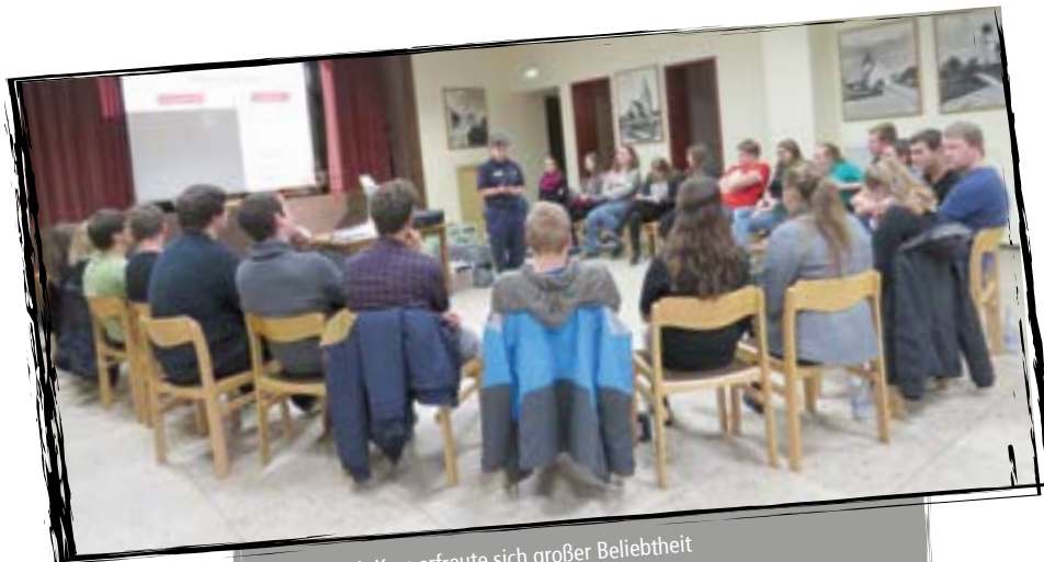
Der Refresh Kurs erfreute sich großer Beliebtheit

Was tun, wenn jemand zusammenbricht oder bewusstlos wird? 27 Teilnehmerinnen und Teilnehmer der KLJB Eichstätt aus den Ortsgruppen Deining und Seubersdorf nahmen am 27.10.2016 an dem Erste Hilfe Refresh Kurs teil und frischen ihre Kenntnisse über medizinische Lebensrettende Sofortmaßnahmen auf.