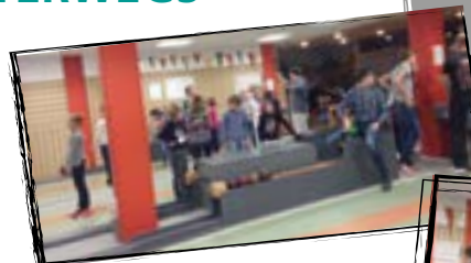
Nachwuchskegler der Ortsgruppe Buchdorf

Um ein wenig Abwechslung in unsere Gruppenstunden zu bringen stand Anfang Oktober „Kegeln“ auf unserem Programm. Los ging es mit über 30 Kindern und Jugendlichen im Alter von 9 bis 18 Jahren zur Kegelbahn nach Donauwörth. Nach anfänglichen Schwierigkeiten (die Kugeln sind fast so schwer wie unsere Jüngsten) wurden dann auch Treffer gelandet. Allerdings sind zum Kegelprofi noch die einen oder anderen Übungsstunden notwendig. Ein Ausflug zur Kegelbahn ist aber auf jeden Fall weiterzempfehlen!