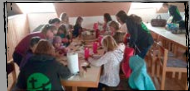
Bastel- und Spielbetreuung der Ortsgruppe Buchdorf beim 350-jährigen Jubiläum