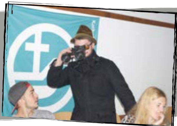
Neuwahlen: Auf der Suche nach neuen Diözesanvorsitzenden!