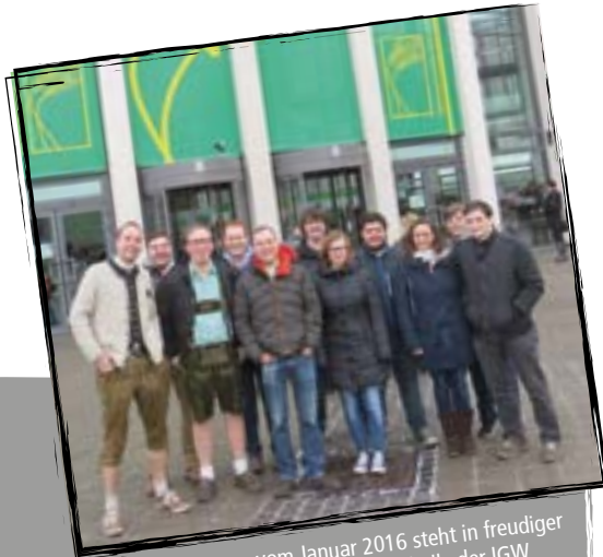
Die Fahrtengruppe vom Januar 2016 steht in freudiger Erwartung vor der riesigen Eingangshalle der IGW

Einmal noch chic angezogen bevor es zurück nach Hause geht – beim Landjugendball