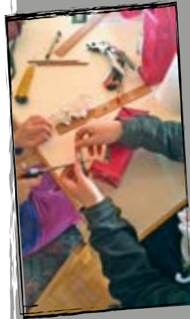
Mit buntem Klebeband und Stickers verwandelten sich die Milchtüten in kreative Vogelhäuser