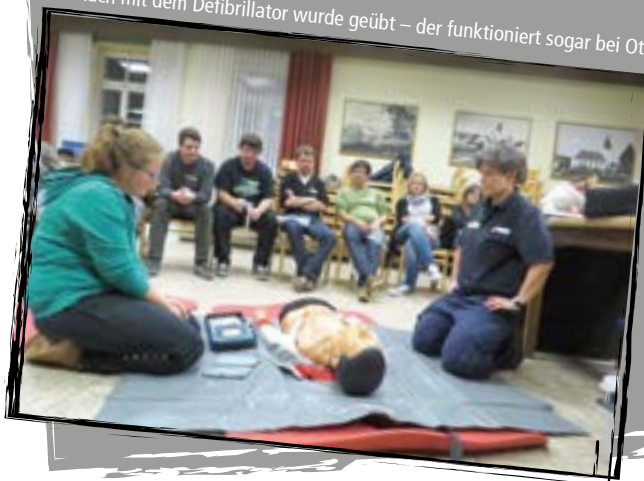
Auch mit dem Defibrillator wurde geübt – der funktioniert sogar bei Otto

Gut, die Klebepads des Defibrillators schon mal gesehen zu haben, damit man für den Ernstfall gewappnet ist