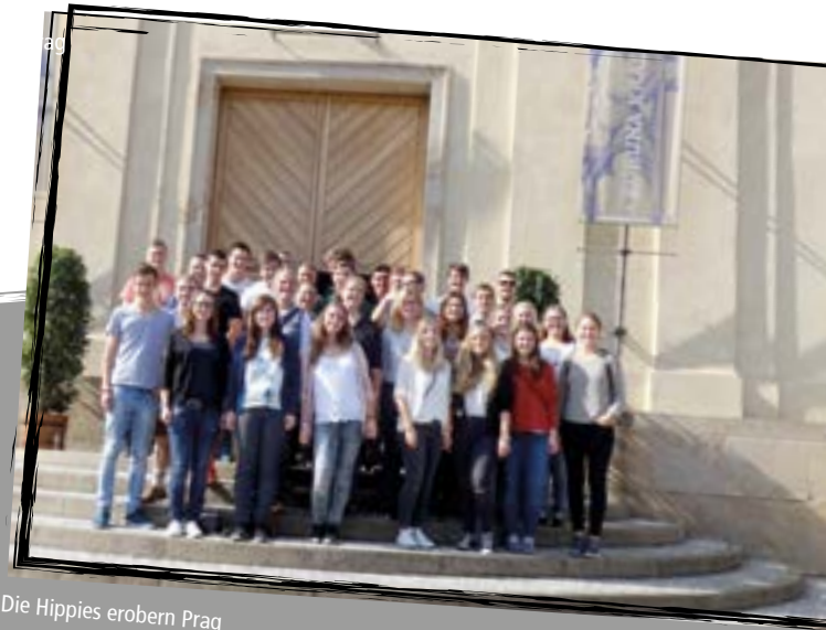
Die Hippies erobern Prag