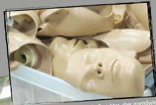
Otto hat zwar viele Gesichter, aber irgendwie sehen die alle gleich aus