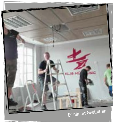
Es nimmt Gestalt an

Mitte September ging es dann ans Eingemachte. Von nun an drehte sich alles um den Strom. Da wir unsere Lichtfunktionen und -versorgungen änderten oder neu einrichteten, war viel Arbeit am Verteilerkasten und an den jeweiligen Endkomponenten notwendig. Auch die Kabelkanäle mussten alle durchforscht und zum Teil modifiziert werden. Steckdosen, die Musikanlage, TV-Kabel, Beleuchtung, alles neu anschließen bzw. neu verkabeln - auch diese ganze Arbeit nahm einige Stunden in Anspruch.