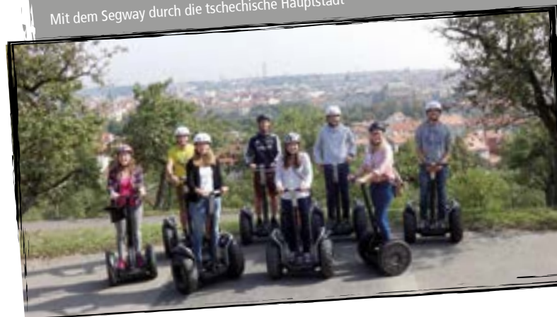
Mit dem Segway durch die tschechische Hauptstadt