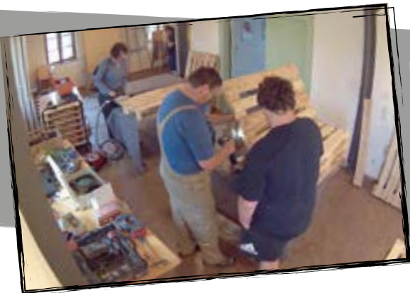
Die KLJB folgt dem Upcycling-Trend und stellt Palettenmöbel her