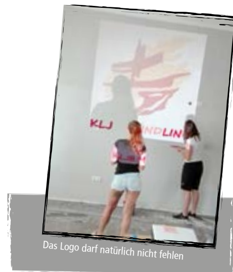
Das Logo darf natürlich nicht fehlen