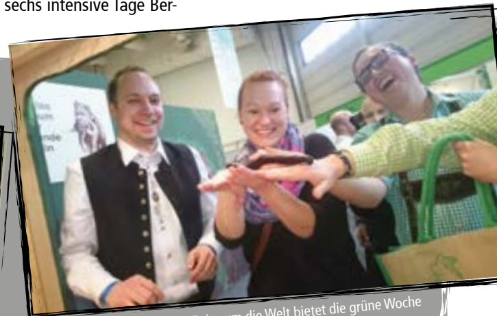
Hautnah erleben – eine Reise um die Welt bietet die grüne Woche