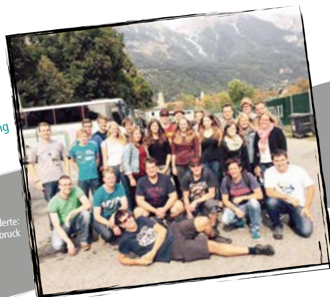
Eine Reise durch die Jahrhunderte: Die Landjugend zur Stadtführung in Innsbruck