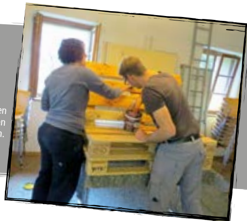
Die fleißigen Helfer verliehen den Palettenmöbeln ihren letzten Anstrich.