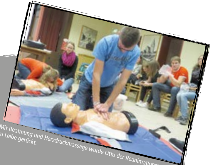
Mit Beatmung und Herzdruckmassage wurde Otto der Reanimationspuppe zu Leibe gerückt.