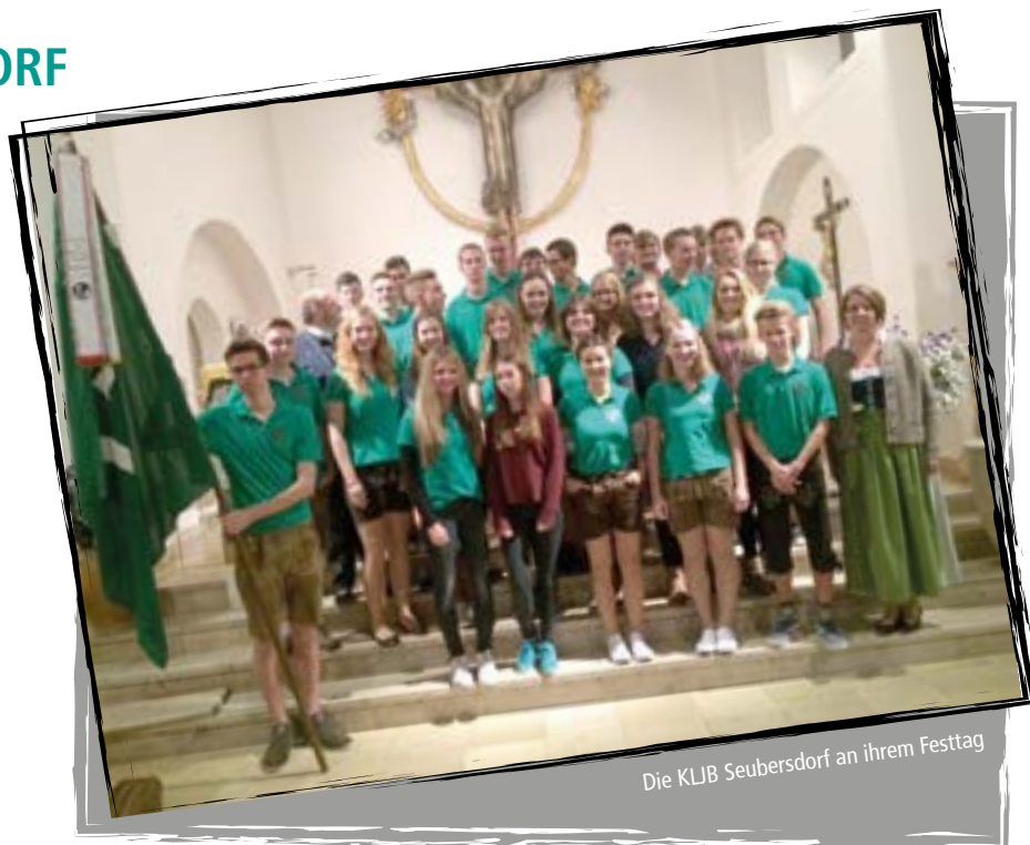
Die KLJB Seubersdorf an ihrem Festtag

Somit hatten wir es geschafft in Seubersdorf eine weitere Veranstaltung auf die Beine zu stellen und Besucher anzulocken. Der Höhepunkt des Abends war der bayrische Wettkampf, an dem 18 Mannschaften mit jeweils 3 Teammitgliedern teilnahmen. Die Mannschaften mussten folgende Aufgaben bewältigen: Maßkrug stemmen, Nogeln am Nogelstock und einen Wüstenschnaps / Semmelbrösel Schnaps trinken, anschließend einen Luftballon aufblasen. Vorher musste im Team gemeinsam beschlossen werden, wer welche Aufgabe übernimmt. Und ruckizucki war ein schöner Abend im Oktoberfestflair auch schon rum.