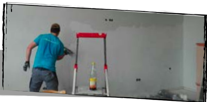
Es wird verputzt!

Das Highlight unseres neuen Raums ist der neue Lichterhimmel. Allein schon aus energiespartechnischen Gründen war es keine Frage, dass hier etwas Neues her muss. Und da unsere Musikanlage auch Altersbeschwerden aufzeigte, war es besiegelt: Etliche Nerven kostende und schweißtreibende Stunden nahm es auf sich, das Grundgestell aus Aluminium-Konstruktionsprofilen zusammenzubauen, die Unterteilungen im Winkel auszurichten und das ganze Gestell an den bereits vorhandenen Gewindestangen aufzuhängen. Natürlich alles gerade und rechtwinklig. Teilweise war die Situation so verflixt und schwierig, dass manche Stimmung zum Teil am Tiefpunkt war. Doch Zusammenraufen und Durchhaltevermögen brachten das lang ersehnte Resultat. Das Gestell hängt am Himmel so, wie es soll. Nun waren die Füllungen, beschichtete Spanplatten mit Holzdekor, an der Reihe. Auch diese mussten an jeder Ecke angepasst, bekantet und mit der ganzen Elektrik und der Beleuchtung versorgt werden. Als dann Platte für Platte oben war, stieg gleichzeitig die Vorfriede immer mehr. Langsam sieht man etwas!